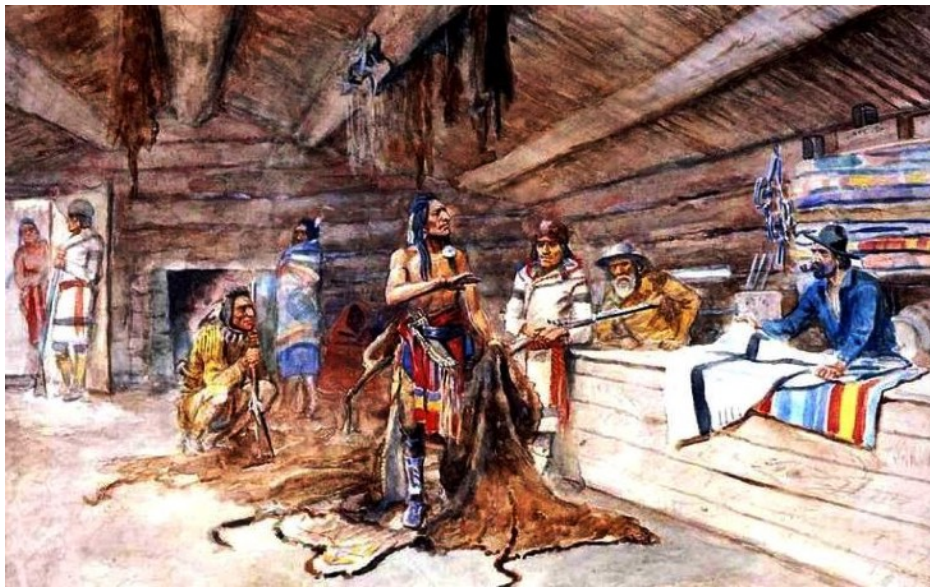
Comptoir de traite des fourrures

Jusqu'au Golfe du Mexique par le Mississipi : Robert Cavelier de la Salle (1681-1682)