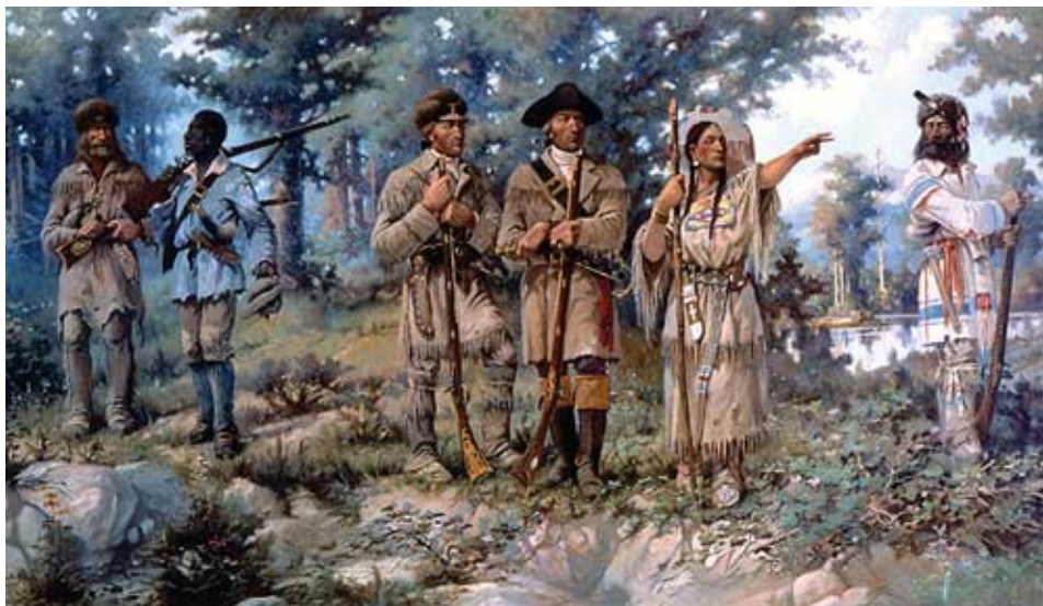
Expédition Lewis et Clark

La première traversée du continent américain : Meriwether Lewis et William Clark, (1804-1805) Le Mustang